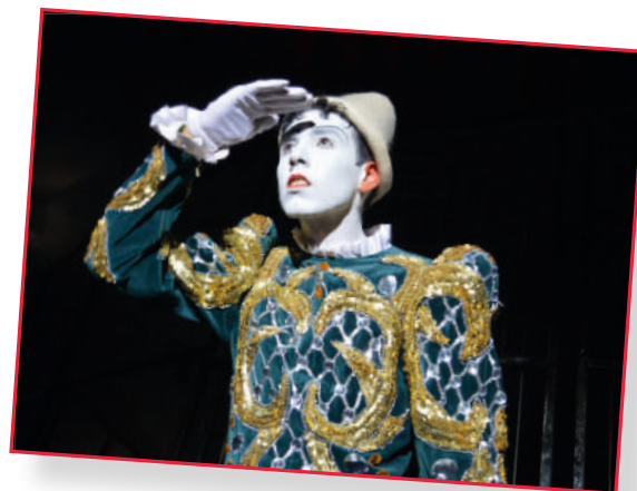
Le clown blanc

Par comparaison au clown de cirque représenté par l'Auguste reconnaissable à son nez rouge et le clown blanc, qui lui n'a pas de nez, le clown-théâtre se démarque par l'approche de la construction de son clown, basée sur l'instinct. Il tire son personnage contemporain de ce qu'il est vraiment, un être à l'écoute de ses émotions. Il agit en fonction des réactions du public. Sa matière première est l'instant présent , il travaille son clown dans l'improvisation , souvent sur un mode burlesque et avec parfois une folle envie d'organiser le désordre.