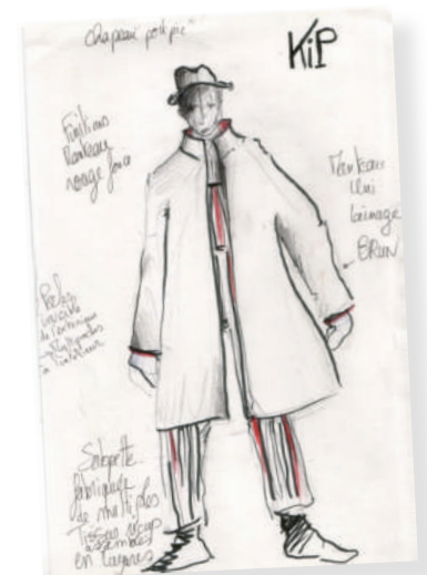
Esquisses Karine Delaunay